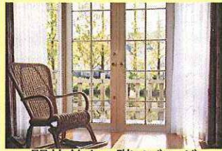
開放的な1階リビング